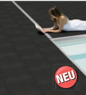
terrazza Terrassenkassette, carbone