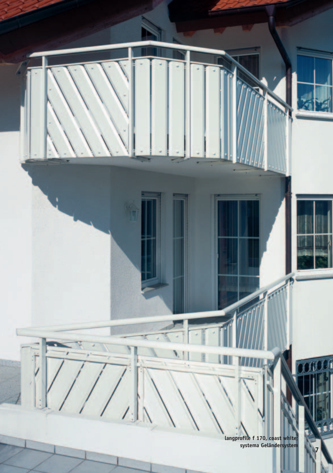
langprofile f 170, coast white; systema Geländersystem